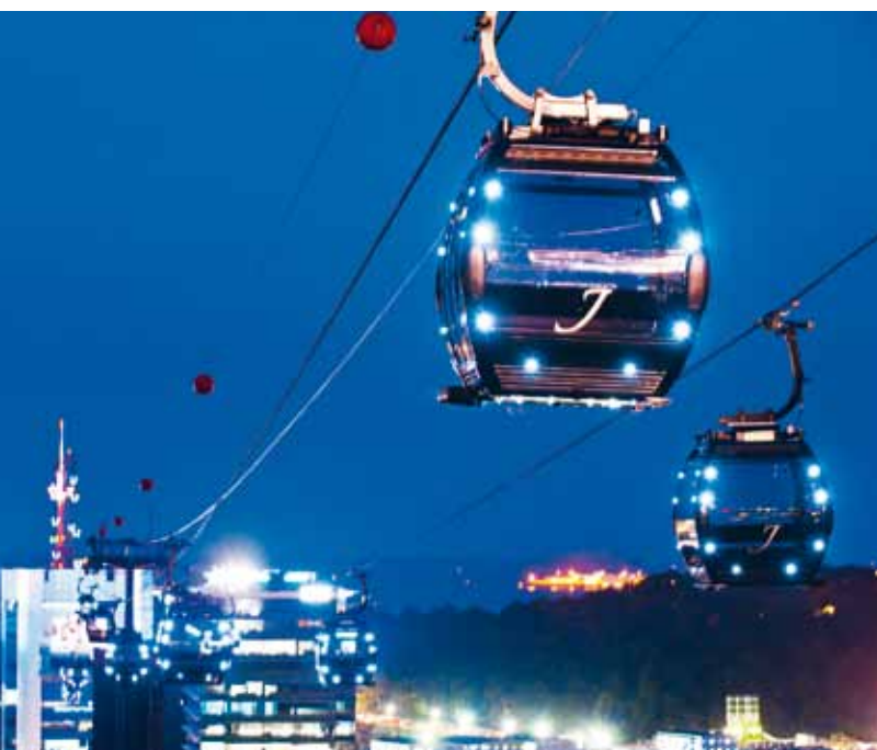
Cabinovia ad ammortamento automatico – Singapore, SGP