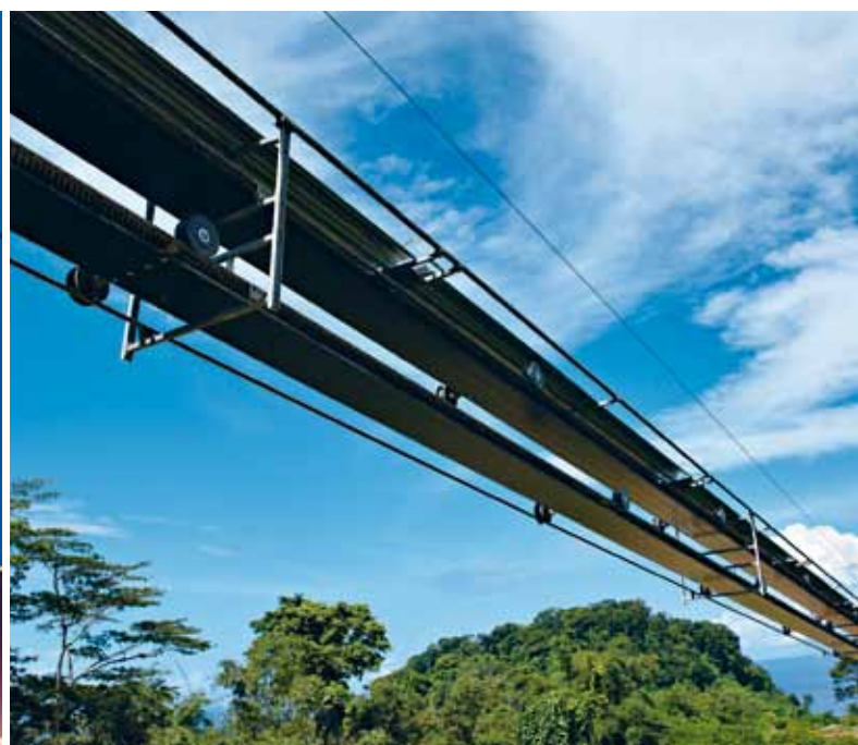
RopeCon® – Simberi, PNG