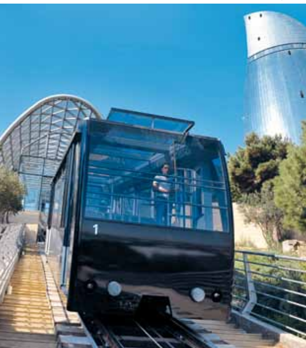
Funicolare – Bakou, ASE