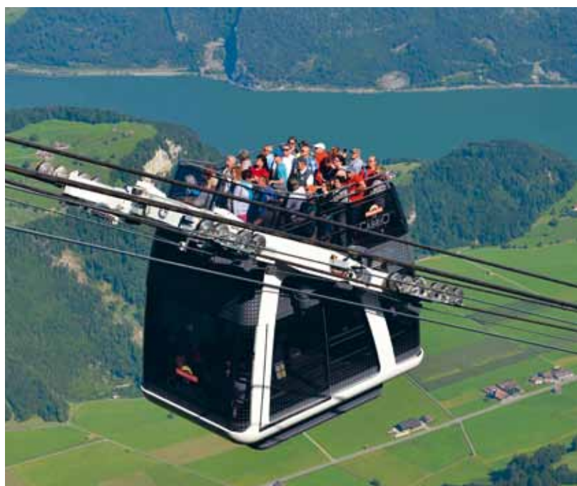
Funivia a va e vieni – Stans, CHE