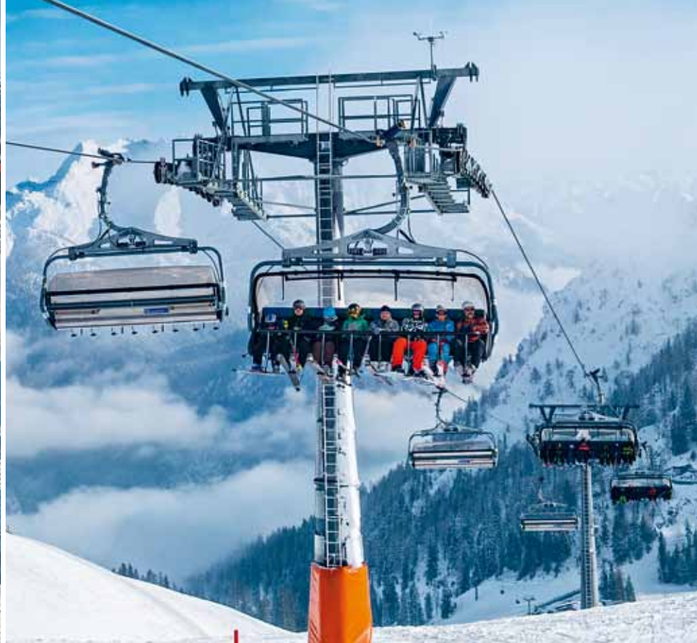
Kuppelbare Sesselbahn – Lofer, AUT