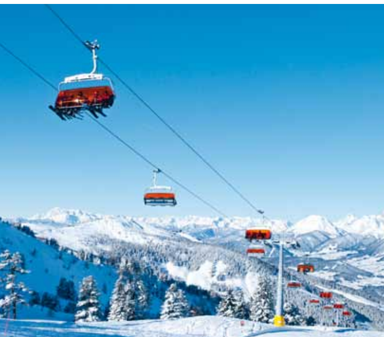
Kuppelbare Sesselbahn – Haus im Ennstal, AUT