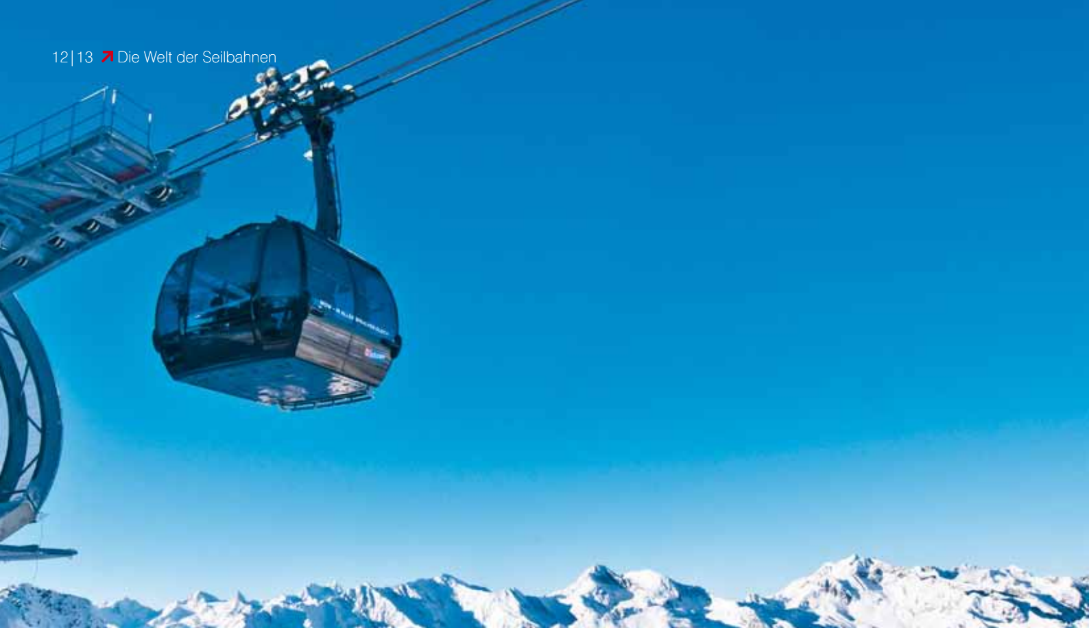
3S Bahn – Sölden, AUT