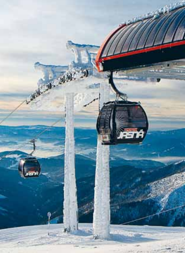
Kuppelbare Gondelbahn – Demänorská dolina, SVK