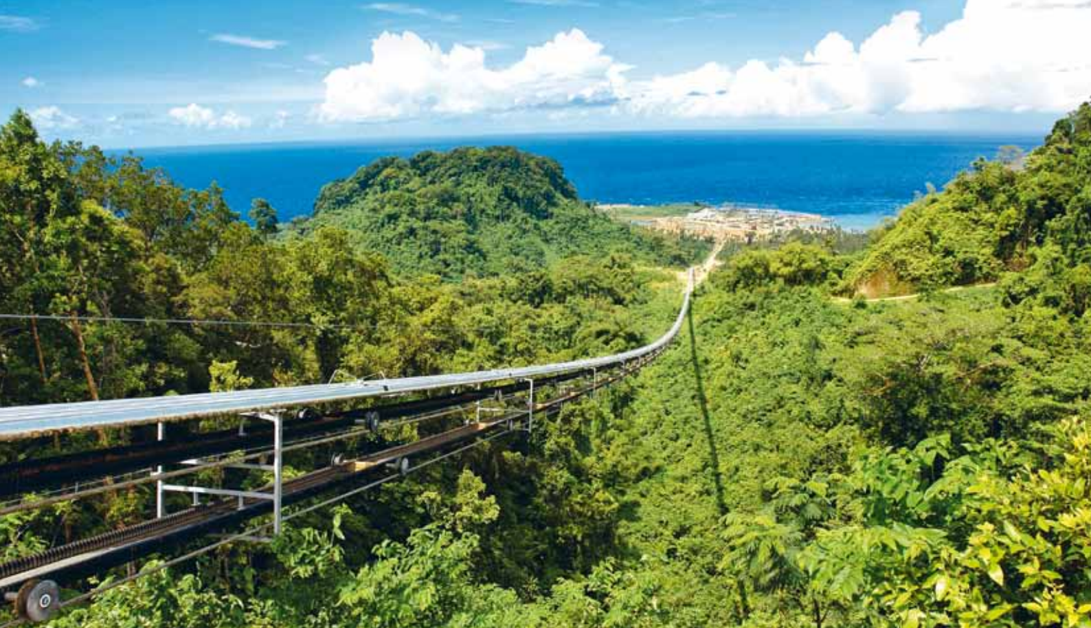
RopeCon® – Simberi, PNG